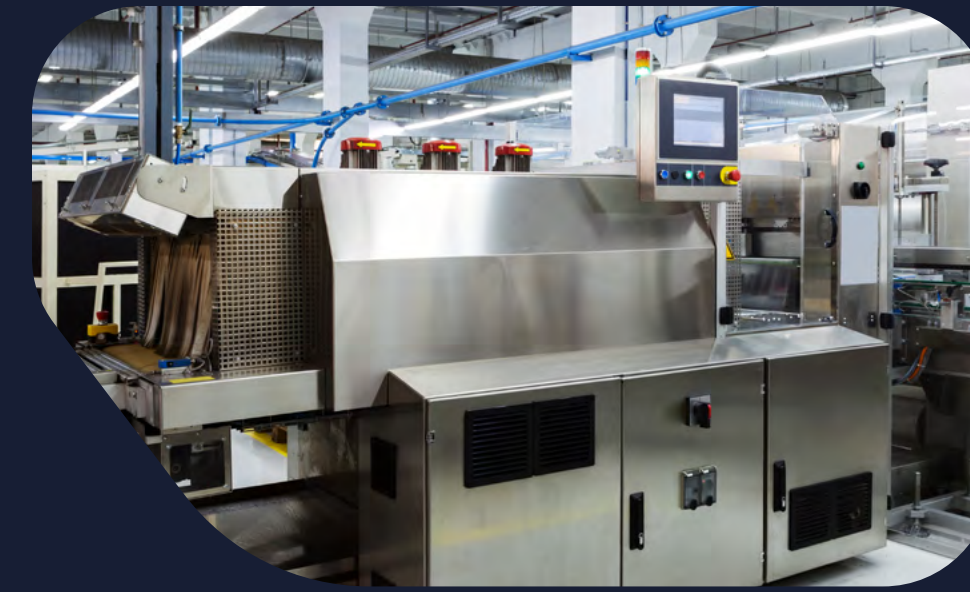
Maquinaria pesada e industrial

Brindamos soluciones logísticas para diversas industrias, minimizando el tiempo de inactividad en manufactura, petróleo y gas, química y farmacéutica, minería, ferrocarril, automotriz, cuidado de la salud, procesamiento de alimentos y construcción, entre otras.