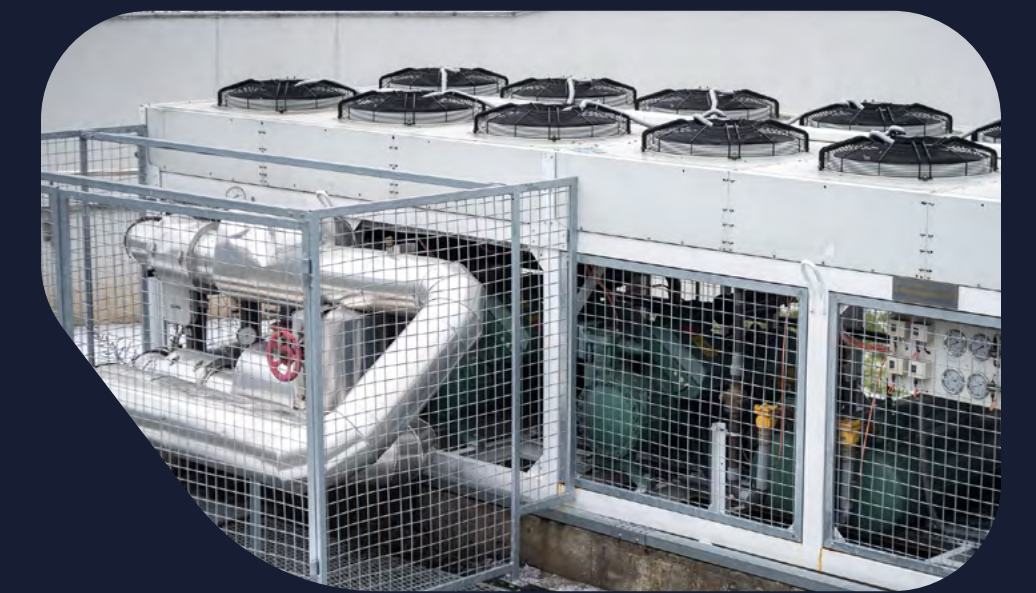
Suministros para instalaciones