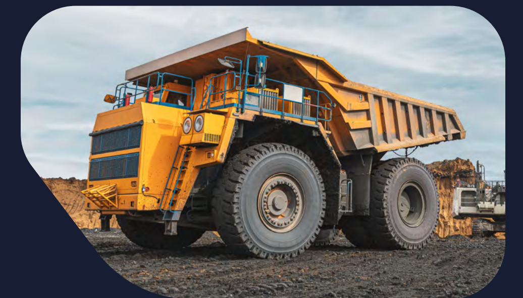
Equipamiento de infraestructura