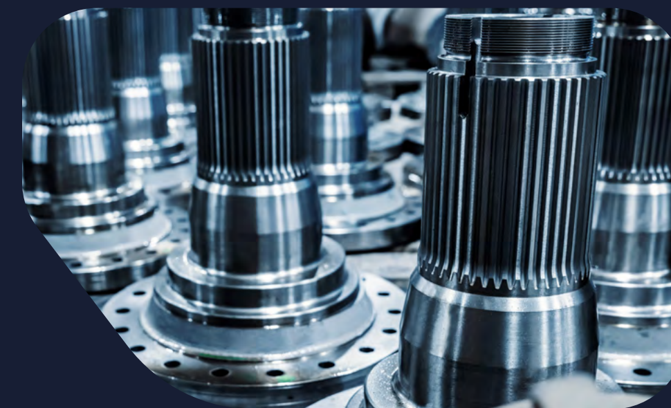
Inventario de piezas de repuesto