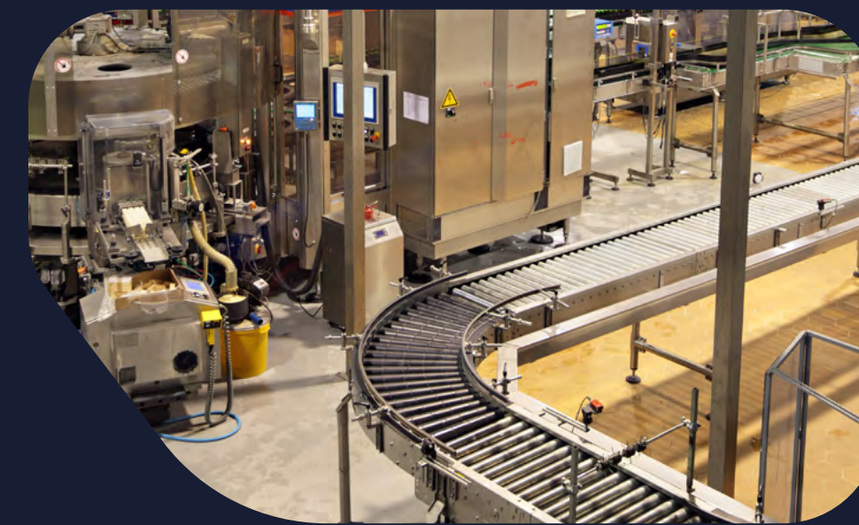
Líneas de producción